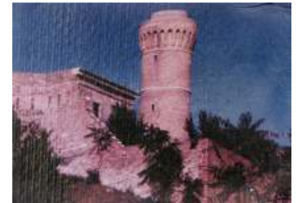
Una cartolina dal Cardeto: il Faro Vecchio e l'edificio da dove Guglielmo Marconi eseguì gli esperimenti radio nel 1904.